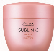
Unruly Hair (U) ふんわりとまとまる仕上がりに