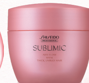
Thick, Unruly Hair (T) ボリュームを抑えながらさらりとまとまる仕上がりに